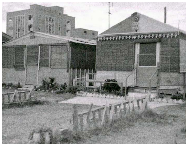
La torre de la Paperera guaitant per damunt de les casetes que hi havia al Passeig Marítim de Patacona, tot desaparegut en l’actualitat.

Això ens pot donar idea de la potència industrial a la qual ens estem referint.