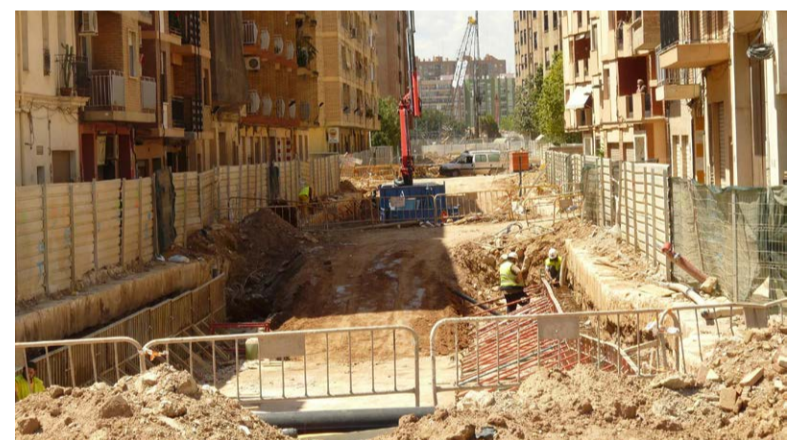
Obres de soterrament de vies al carrer València d'Alboràia

- Una obra com la del "Metro" és responsabilitat exclusiva de la Generalitat Valenciana. De la mateixa manera que hi ha infraestructures que són competència de l'Estat (Renfe). I és normal, que cada organisme es faça càrrec del 100% del cost total d'una obra que és competèn-