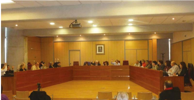
Una de les votacions, al Ple municipal, on PP i PSOE han votat conjuntament aquesta legislatura.

La instrucció del cas de l'exalcalde del PP a Alboràia continua al Jutjat de Primera Instància de Montcada