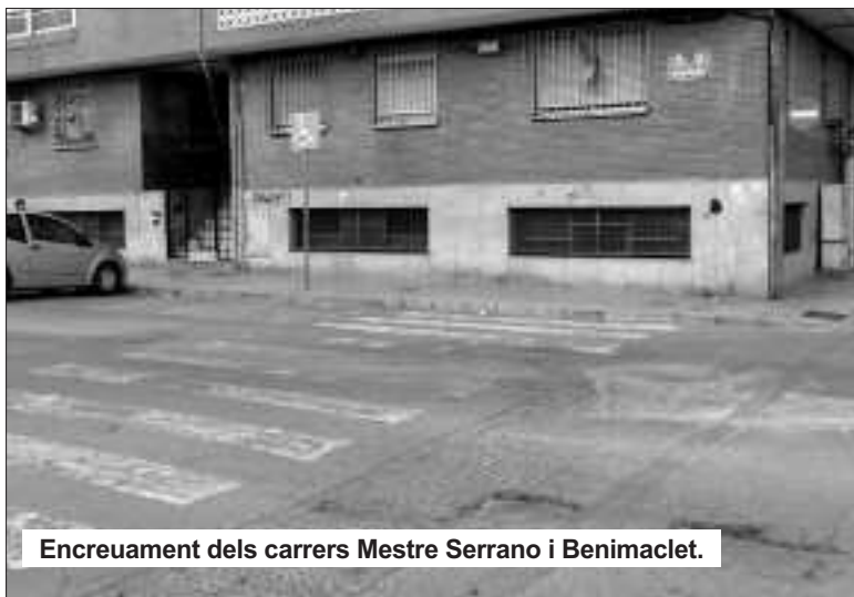
Encreuament dels carrers Mestre Serrano i Benimaclet.

El Bloc es va reunir amb un grup de veïns que posteriorment han traslladat les seues peticions a l'Ajuntament