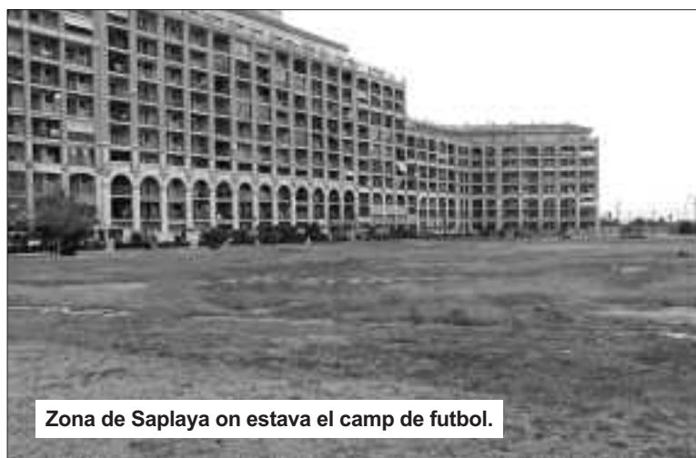
Zona de Saplaja on estava el camp de futbol.

El PP diu que el pressupost per adequar els locals municipals del barri Rei en Jaume és molt alt i per això no farà res, però gasta en altres partides