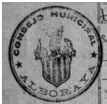
Escut republicà de l'Ajuntament d'Alboraia utilitzat en 1939