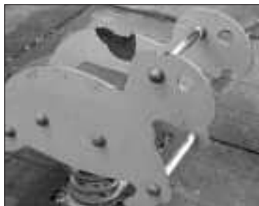
Dalt, un dels joguets del parc que hi ha en l'encreuament amb l'Avinguda Ausiàs March. Baix es veu el mateix lloc que les fotos de la dreta, des del carril bici.

No en som pocs els pares que hem hagut de córrer darrere els nostres fills per tal que no accediren a la ronda de sobte. La fórmula seria tan senzilla com continuar la barrera d'arbusts existent. O es podria fer d'altra manera, però seria molt important poder comptar amb eixa barrera física. Què us sembla?