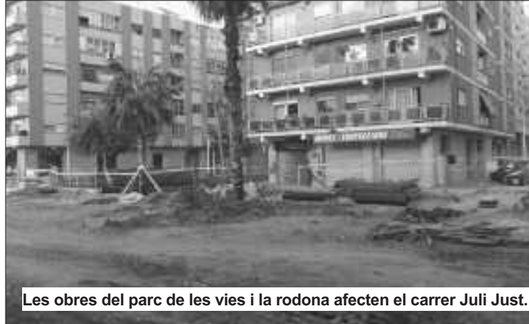
Les obres del parc de les vies i la rodona afecten el carrer Juli Just.

EG: no totes les queixes veïnals s'han respost. Fins que no estiga