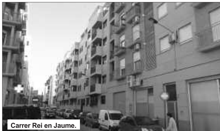
Carrer Rei en Jaume.

10. Empresa Claros : 1. Ens agradaria saber si l'Ajuntament ha presentat demandes contra l'empresa o si Egusa ha iniciat algun procediment judicial contra Claros? També si Claros ha iniciat algun procediment judicial contra l'Ajuntament o l'empresa Egusa? També volem saber quan